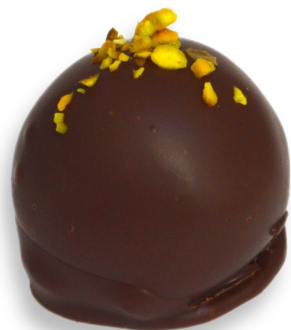
BROWNIE COM PISTACHE R$ 4,50