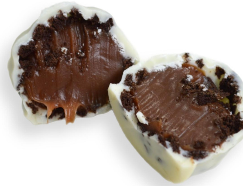
COOKIES N CREAM COM BRIGADEIRO DE NUTELLA R$ 4,00