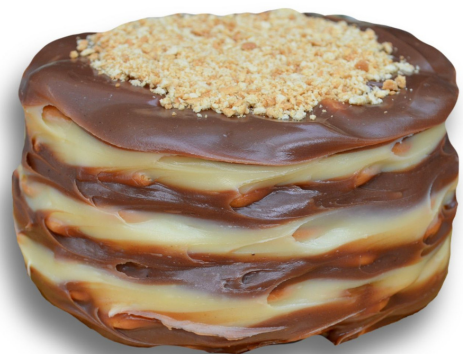
TORTA PALHA ITALIANA R$ 115,00 o quilo

Camadas de brigadeiro ninho e belga intercaladas com camadas de biscoito maisena. Entre em contato para disponibilidade de outros sabores de brigadeiro para rechear a sua torta