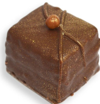
WAFER NUTELLA R$ 4,90