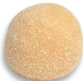
LEITE NINHO R$ 3,60