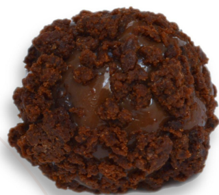
BRIGABROWNIE R$ 4,20