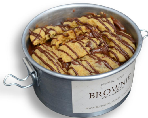
BROWNIE COOKIE - 300G R$ 55,00