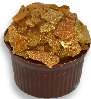
CARAMELO SALGADO R$ 4,80