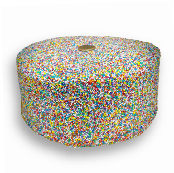
BOLO DRAGE R$ 140,00 o quilo

Bolo chocolate recheado com brigadeiro belga, coberto com brigadeiro belga e confeito tipo drage. Entre em contato para disponibilidade de outros sabores de brigadeiro para recheiar o seu bolo.