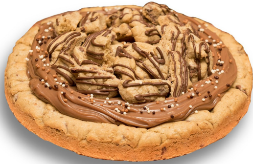
TORTA COOKIE COM NUTELLA R$ 170,00 o quilo

Cookie tarte recheada de Nutella e coberta com brigadeiro belga e cookies. Entre em contato para disponibilidade de outros sabores de brigadeiro para rechear o sua torta.