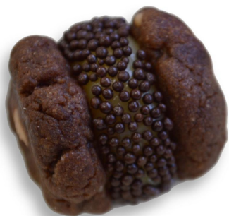
MINI COOKIE CHOCOLATE R$ 4,50