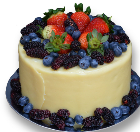
BOLO FRUTAS VERMELHAS R$ 160,00 o quilo

Bolo pão de ló recheado com brigadeiro belga e biscoito maisena. Entre em contato para disponibilidade de outros sabores de brigadeiro para recheiar o seu bolo.