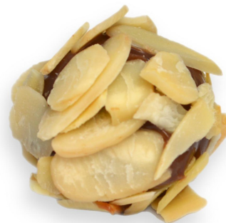
AMÊNDOAS R$ 4,20