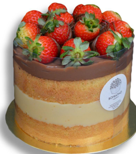
PÃO DE LÕ E MORANGOS R$ 135,00 o quilo

Cookie de baunilha recheado com nutella e coberto com morangos e cookies. Presente especial para pessoas especiais.