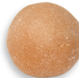
BEM CASADO R$ 3,80