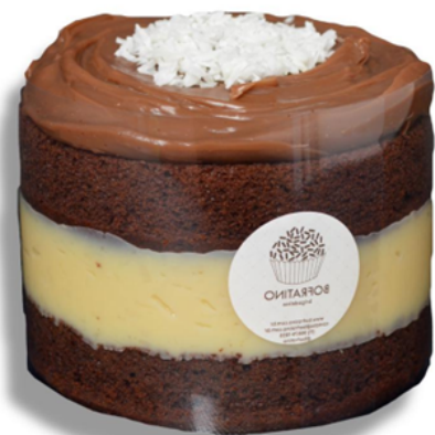
BOLO CHOCOLATE R$ 130,00 o quilo

Bolo chocolate recheado com brigadeiro coco, coberto com brigadeiro belga Entre em contato para disponibilidade de outros sabores de brigadeiro para rechear o seu bolo.