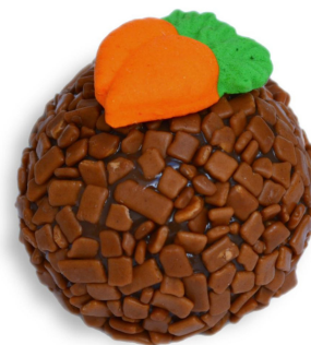
BOLO DE CENOURA R$ 4,20