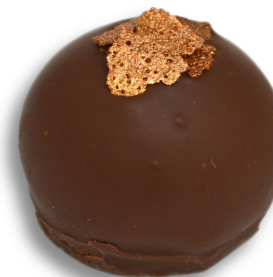
BALA DE BRIGADEIRO R$ 4,50