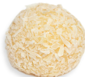
COCO R$ 3,70