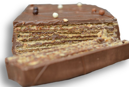
WAFER DE NUTELLA R$ 240,00 o quilo

Naked cake de cenoura recheado com brigadeiro ao leite belga. Entre em contato para disponibilidade de outros sabores de brigadeiro para rechear o seu bolo.