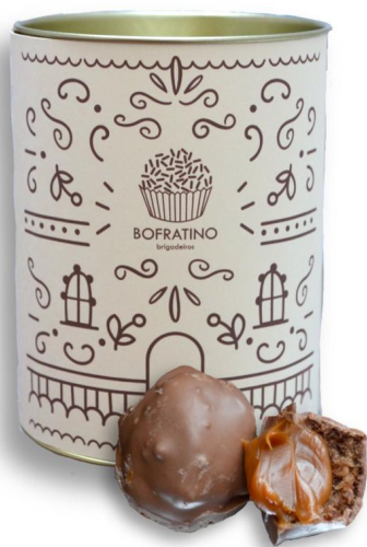
BITES DE PÃO DE MEL - 10 UN. R$ 70,00