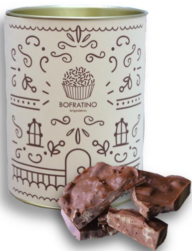
BARRAS DE WAFER COM NUTELLA - 100G R$ 70,00