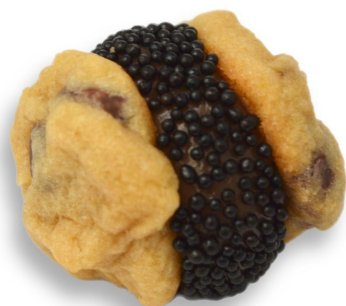
MINI COOKIE BAUNILHA R$ 4,50