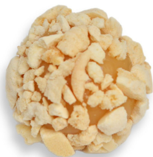
MERENGUE DE LIMÃO R$ 3,80