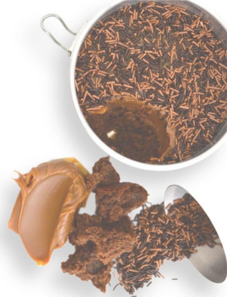
PÃO DE MEL DE COLHER - 300G R$ 50,00