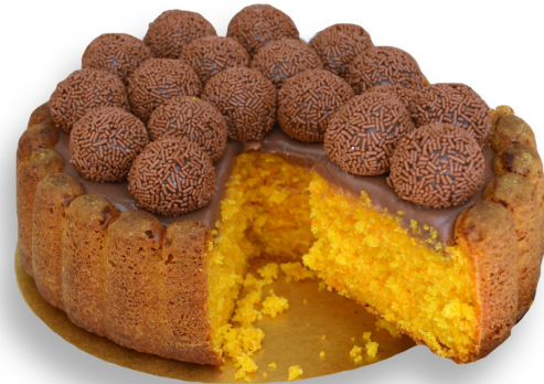
BALLERINE DE CENOURA R$ 130,00 o quilo

Cookie tarte recheada de Nutella e coberta com brigadeiro belga e cookies. Entre em contato para disponibilidade de outros sabores de brigadeiro para rechear o sua torta.