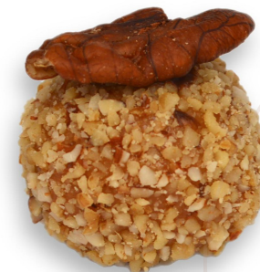
NOZ PECAN R$ 4,20