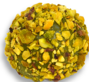
PISTACHE R$ 4,50