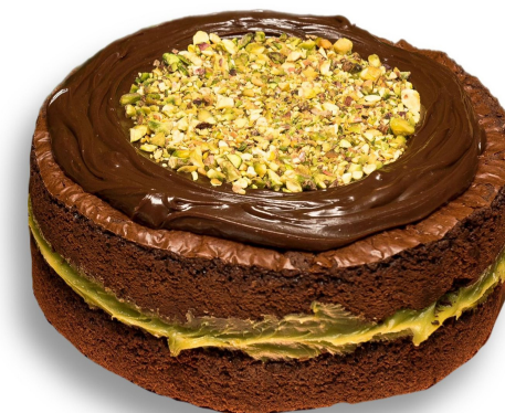
BOLO BROWNIE COM PISTACHE R$ 145,00 o quilo

Camadas de wafer intercaladas com Nutella, cobertos com chocolate ao leite belga. Combinação que dá água na boca.