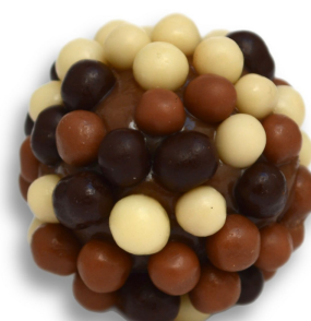
TRIO CHUMBINHO R$ 4,20