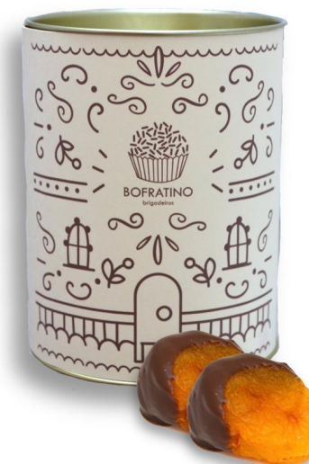
DAMASCO COM DOCE DE LEITE - 10 UN R$ 90,00