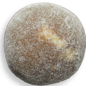
BRIGADEIRO PALHA ITALIANA R$ 3,80