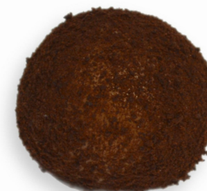
OREO R$ 3,70