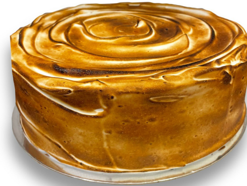
MERENGUE MAÇARICADO R$ 140,00 o quilo

Ballerine de cenoura com brigadeiros ao leite. Entre em contato para disponibilidade de outros sabores de brigadeiro para rechear o seu bolo.