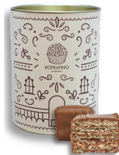
WAFER DE NUTELLA - 10 UN. R$ 80,00