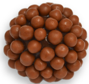
CHUMBINHO AO LEITE R$ 4,20