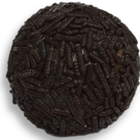
MEIO AMARGO R$ 4,00