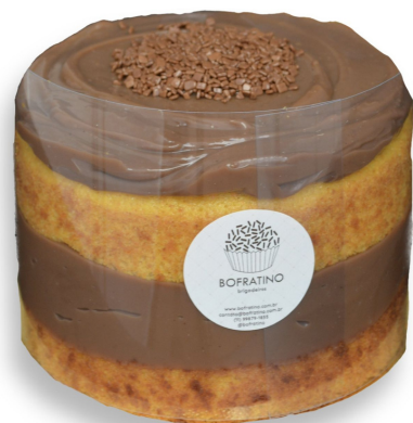
BOLO DE CENOURA NAKED R$ 130,00 o quilo

Camadas de brigadeiro ninho e belga intercaladas com camadas de biscoito maisena. Entre em contato para disponibilidade de outros sabores de brigadeiro para rechear a sua torta