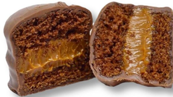
PÃO DE MEL R$ 6,10

Bolinho de cenoura recheado com brigadeiro ao leite coberto com chocolate.