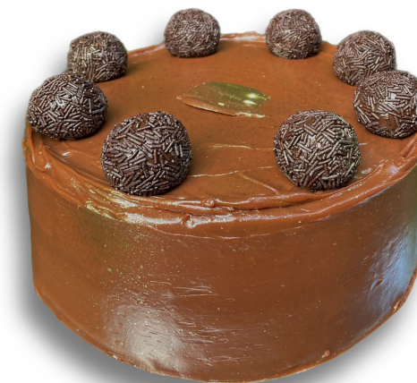
TRIPLE COCOA R$ 140,00 o quilo

Bolo pão de ló recheado com brigadeiro ninho e coberto com brigadeiro ao leite e morangos Entre em contato para disponibilidade de outros sabores de brigadeiro para rechear o seu bolo.