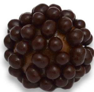
CHUMBINHO MEIO AMARGO R$ 4,20