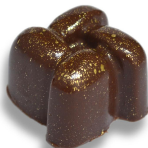
CROCANTE DE CHOCOLATE R$ 4,50