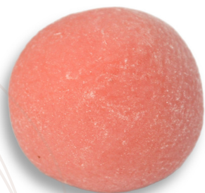
BICHO DE PÉ R$ 3,60