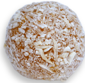
DOCE DE LEITE COM COCO R$ 3,70