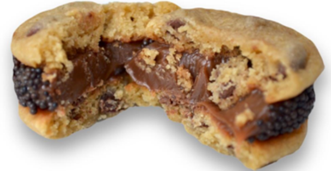
SANDUÍCHE DE COOKIE R$ 6,80

Bolinho de mel recheado com brigadeiro ou doce de leite, coberto com chocolate.