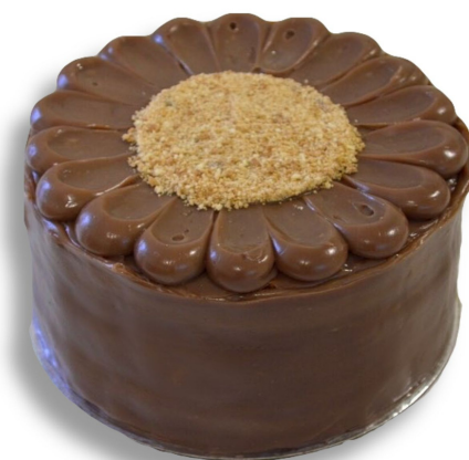
BOLO PALHA ITALIANA R$ 140,00 o quilo

Bolo chocolate recheado com brigadeiro belga, coberto com brigadeiro belga e confeito tipo drage. Entre em contato para disponibilidade de outros sabores de brigadeiro para recheiar o seu bolo.