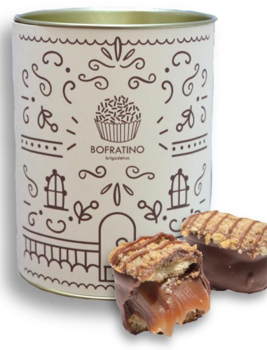
BITES PALHA ITALIANA - 10 UN. R$ 70,00