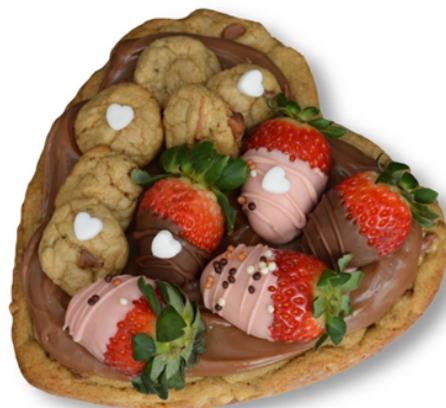
COOKIE HEART R$ 95,00 - 500g

Bolo chocolate recheado com brigadeiro coco, coberto com brigadeiro belga Entre em contato para disponibilidade de outros sabores de brigadeiro para rechear o seu bolo.