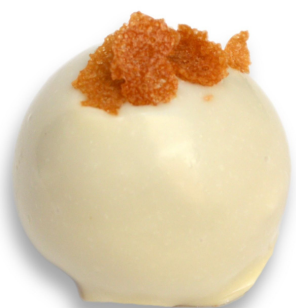
BALA DE DOCE DE LEITE R$ 4,50