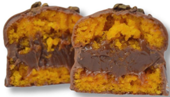
KAROTINO R$ 6,10

Bolinho de cenoura recheado com brigadeiro ao leite coberto com chocolate.