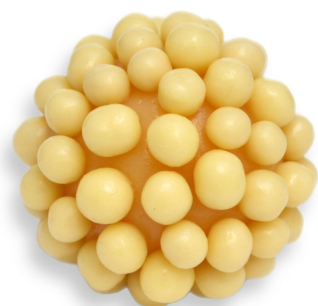
CHUMBINHO BRANCO R$ 4,20