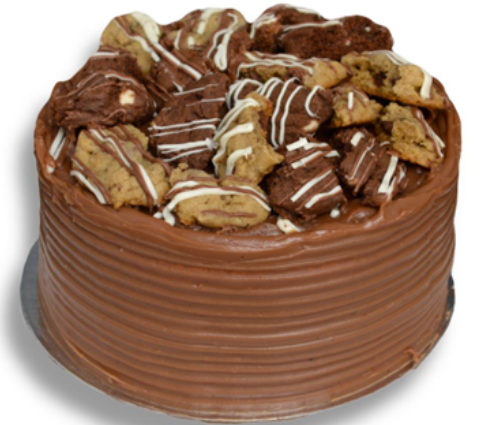
BOLO DUO COOKIE R$ 140,00 o quilo

Bolo pão de ló recheado com brigadeiro belga e ninho coberto com merengue maçaricado. Entre em contato para disponibilidade de outros sabores de brigadeiro para rechear o seu bolo.