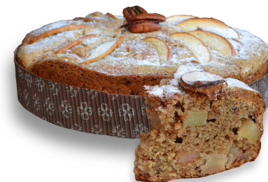
BOLO DE MAÇA COM NOZES R$ 130,00 o quilo

Bolo pão de ló recheado com brigadeiro belga e coberto com brigadeiro branco e frutas vermelhas. Entre em contato para disponibilidade de outros sabores de brigadeiro para recheiar o seu bolo.