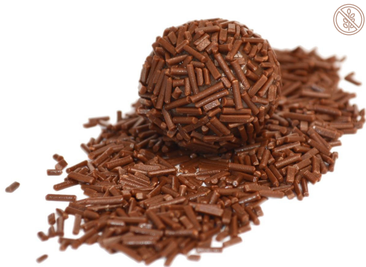
AO LEITE BELGA R$ 4,00