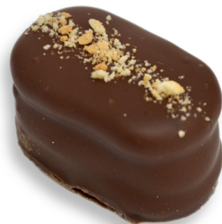
BITES PALHA ITALIANA R$ 4,50